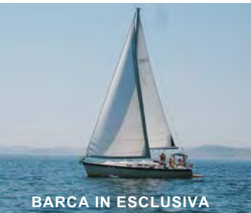
BARCA IN ESCLUSIVA