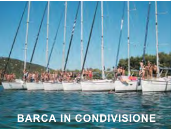
BARCA IN CONDIVISIONE